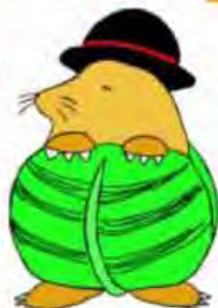
大会マスコットキャラクター モグ沢キャベ治